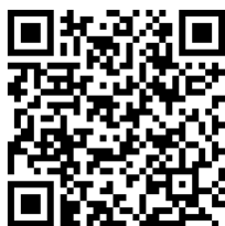
全空連マイページ QRコード